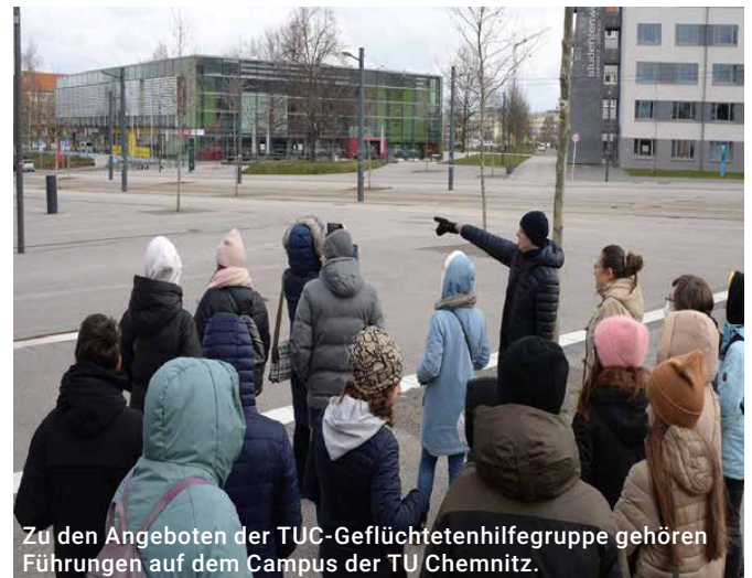
Zu den Angeboten der TUC-Geflüchtetenhilfegruppe gehören Führungen auf dem Campus der TU Chemnitz.